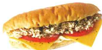
ツナトマトチーズ

フレッシュトマト、ツナ、チーズのフレッ シュハーモニー。 男性も満足なボリュームミーな一品です。