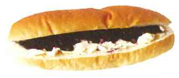
ブルーベリークリームチーズ

減農薬のブルーベリーで作った手作り ジャム。ブルーベリーの香りとクリー ムチーズの酸味がベストマッチ