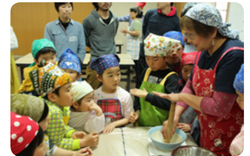
わかりやすい言葉で、小さな子どもにも教えています。