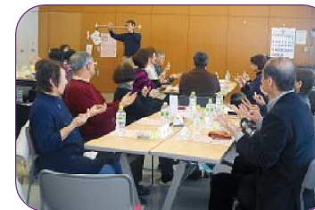
皆さん楽しんで頂けました。